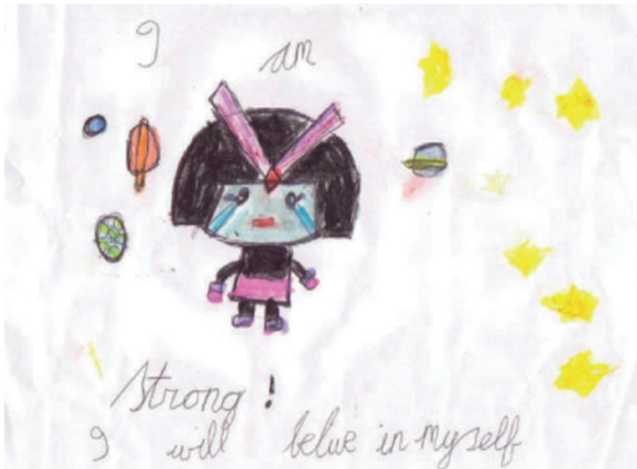
Smurtą patyrusio asmens vaiko piešinys

„Netikslinga, kad po to, kai kažkas jums pakenkė, turite iš naujo kurti savo gyvenimą. Tai vargina, skaudina ir kartais sunku susitaikyti su prarastu laiku. Tačiau jūs išgyvenote ir jau įrodėte, kad esate drąsus (-i), stiprus (-i) ir galite pakeisti savo gyvenimo kryptį. Šios savybės jus palaikys.“